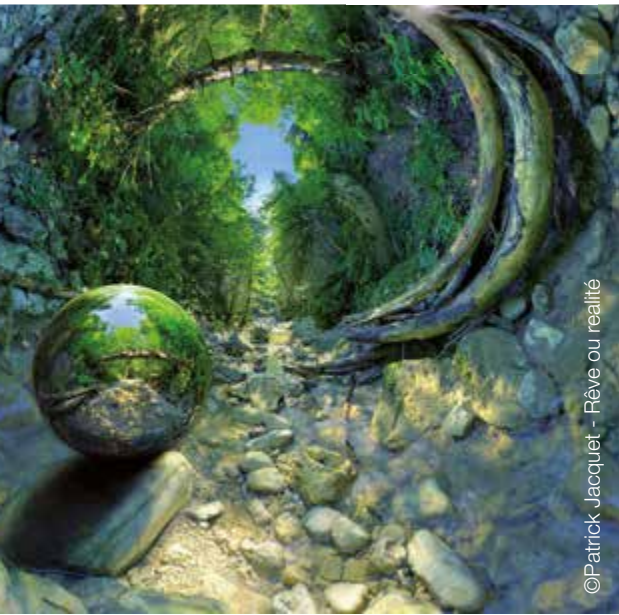
Rêve ou réalité