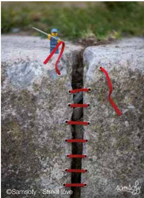
Street love