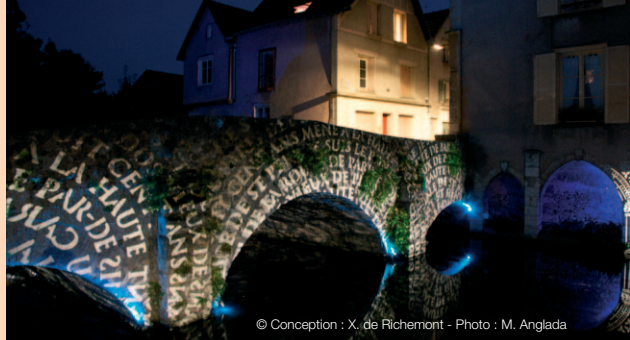
© Conception : X. de Richemont

Pour avoir découvert les 29 sites au mois d'Avril, à la nuit tombée et en semaine, je