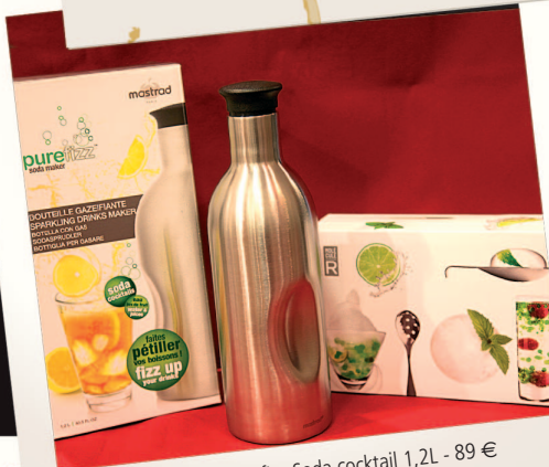
Mastrad Pure fizz Soda cocktail 1,2L - 89 € Mojitos Set moléculaire - 34,90 € Culinarion , 3 Place marceau 28000 Chartres Tél : 02 37 36 78 45