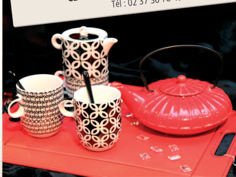
Solitaire - 29 € Set mugs+cuillères - 22,50 € Théière rouge - 19,50 € Plateau 45x35cm - 30 € Ambiance & Styles , 19 rue de la Tonnellerie 28000 Chartres Tél : 02 37 21 01 22