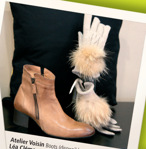
Atelier Voisin Boots (disponibles en noir) - 350 € Léa Clément Gants angora lamé, marmotte - 79 € Aqua Aura , 1 rue de la Pie 28000 Chartres Tél : 02 37 36 42 27