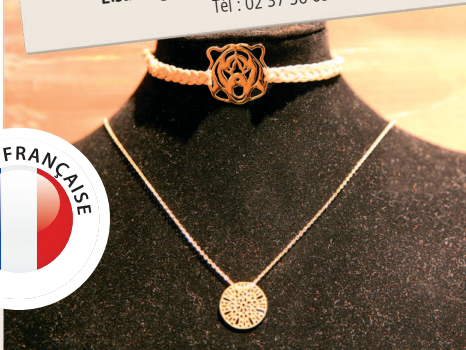
Nilai Bijoux plaqués or ou argent - Bracelet Tiger - 46 € Collier new dentellissime - 45 € La Récré , 24 Place des Halles, 28000 Chartres Tél : 02 37 22 94 48