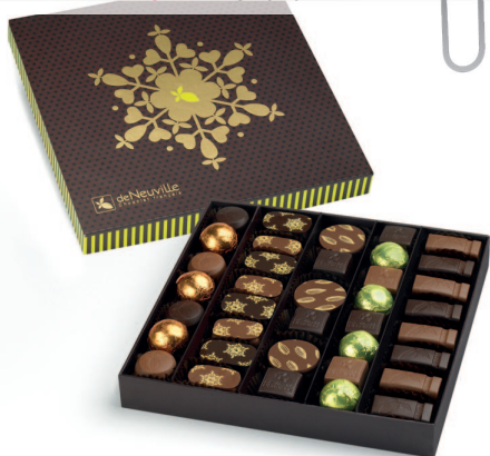
Boite de 370g de chocolats Français. - 26 € DE NEUVILLE , 11 rue de la Pie 28000 Chartres Tél : 02 37 36 02 91