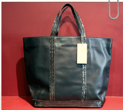
Vanessa Bruno Sac médium cuir - 295 € Autres coloris disponibles, existe en toile à partir de 125 € Toccata , 4 rue des Changes 28000 CHARTRES Tél : 02 37 20 09 82