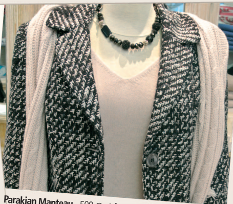
Parakian Manteau - 509 € et Jupe - 189 € - MDC Collier - 59 € Crossways pull - 169 € - Chicama écharpe - 109 € Julie , 5 rue des Changes 28000 Chartres Tél : 02 37 21 42 79