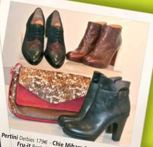
Pertini Derbies 179€ - Chie Mihara Boots bordeaux 339€ Fru-it Boots à talon 259€ - Craie Sac 275€ Aqua Aura , 1 rue de la Pie 28000 Chartres Tél : 02 37 36 42 27