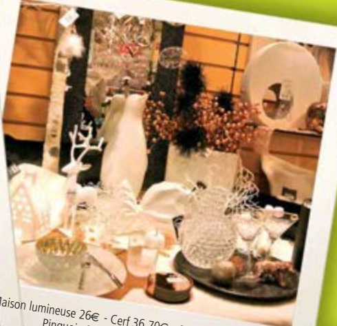
Maison lumineuse 26€ - Cerf 36,70€ - Bouillote fourrure 22,90€ Pinguin 59,90€ - Vase 59,90€ - Broc 75€ Ambiance & Styles , 19 rue de la Tonnerrie 28000 Chartres Tél : 02 37 21 01 22