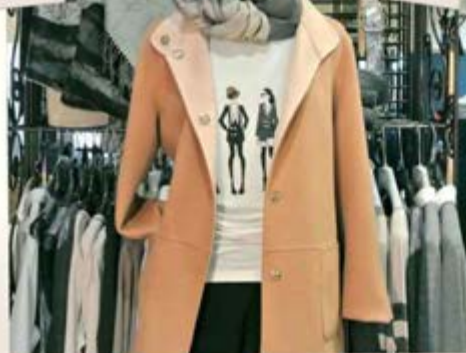
Basler Manteau réversible 679€ Echarpe 169€ Caroline Biss Top 93€ Quiet Pantalon 169€ Tendansses , 13 rue Mathurin Régnier, 28000 Chartres Tél : 02 34 42 83 64