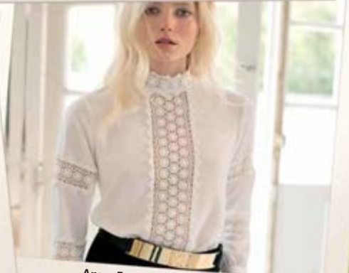
Anne Fontaine Chemisier 250€ Garance Preppy , 12 rue du soleil d'Or 28000 Chartres Tél : 02 34 42 18 87