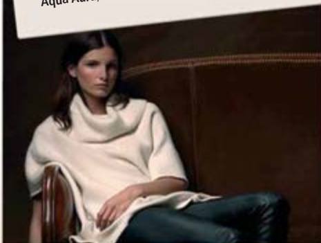
Max & Moi Poncho 100% cachemire 580€ Garance Preppy , 12 rue du soleil d'Or 28000 Chartres Tél : 02 34 42 18 87