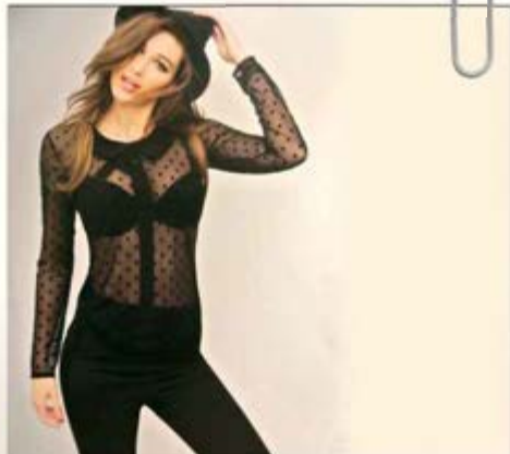
Antigel Top tulle à pois 80€ - Soutien gorges push up 60€ Elsa Lingerie , 25 rue du Soleil d'Or, 28000 Chartres Tél : 02 37 36 65 39