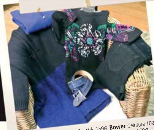
Penny Black Gilet 209€ Pull motifs 159€ Bower Ceinture 109€ Charming Smile Pull V 179€ Gardeur Pantalon 159€ Tendansses , 13 rue Mathurin Régnier, 28000 Chartres Tél : 02 34 42 83 64