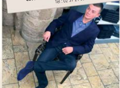
Look Hugo Boss Blazer 490€ - Chemise 133€ Jean's 146€ - Chaussure 273€ Covent Garden , 19 place du Cygne, 28000 Chartres Tél : 02 37 21 93 47