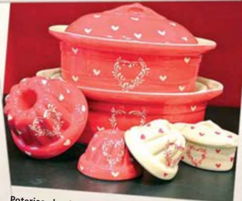
Poteries alsaciennes de Soufflenheim Du mini au maxi Kougelhoph de 11,50 à 31,50€ Terrines ovales de 15 à 89,90€ Culinarion , 3 Place marceau 28000 Chartres - Tél : 02 37 36 78 45