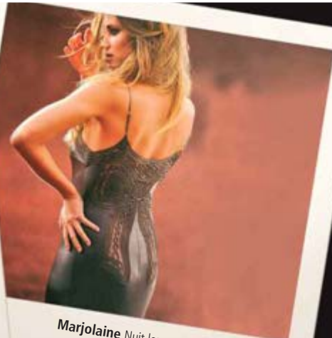
Marjolaine Nuit longue soie 229€ Existe en différents coloris Elsa Lingerie , 25 rue du Soleil d'Or, 28000 Chartres Tél : 02 37 36 65 39