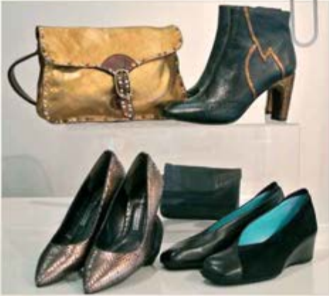
Campomaggi Sac 229€ - Thierry Rabotin Ballerines 275€ Mocassins 309€ - Kennel & Schmenger Escarpins 199€ Craie Porte monnaie 59€ Aqua Aura , 1 rue de la Pie 28000 Chartres Tél : 02 37 36 42 27