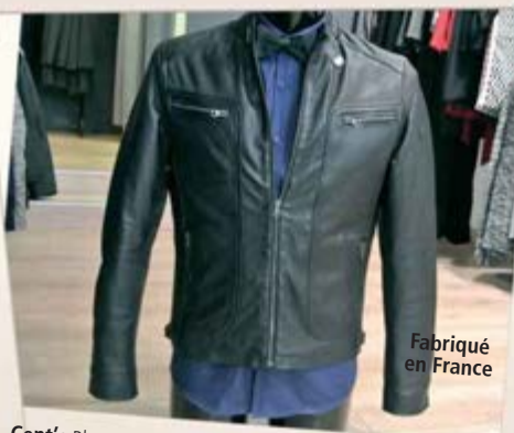
Cent's Blouson cuir homme 299,90€ chemise 79,90€ Nœud 29€ Le Sens du Style 15 rue de la poêle percée 28000 Chartres Tél : 02 37 99 80 19