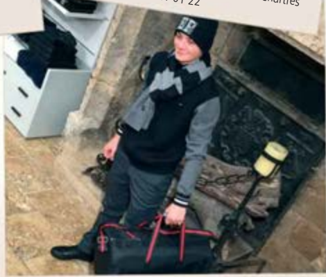
Look Eden Park Cardigan 145€ - Pantalon 155€ - Écharpe 65€ Bonnet 50€ - Chaussures 110€ - Sac de sport 165€ Covent Garden , 19 place du Cygne, 28000 Chartres Tél : 02 37 21 93 47