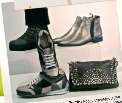
Puro Boots fourrées 399€ - Pertini Boots argentées 215€ Candice Cooper Baskets 249€ - Campomaggi Sac 325€ Aqua Aura , 1 rue de la Pie 28000 Chartres - Tél : 02 37 36 42 27