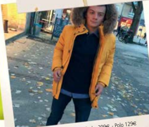
Look Tommy Hilfiger Parka 399€ - Polo 129€ Jean's 129€ Covent Garden , 19 place du Cygne, 28000 Chartres Tél : 02 37 21 93 47