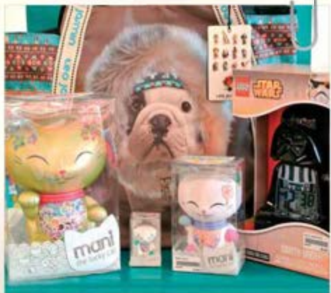
Mani Chat porte bonheur Tirelire 22€ - Porte clé 7,50€ - Figurine 15€ Téo Jasmin Sacs 31€ à 45€ selon modèle - Réveil Dark Vador 49,90€ La Récré , 24 Place des Halles, 28000 Chartres - Tél : 02 37 22 94 48